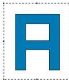
Rys. 3. Tworzenie litery wypełnionej obrazem – zadanie 3.

Uwaga: Jeśli biała część obrazu jest niewidoczna, kliknij zdjęcie i przeciągnij jeden z małych kwadracików na krawędzi obrazu, aby go powiększyć.